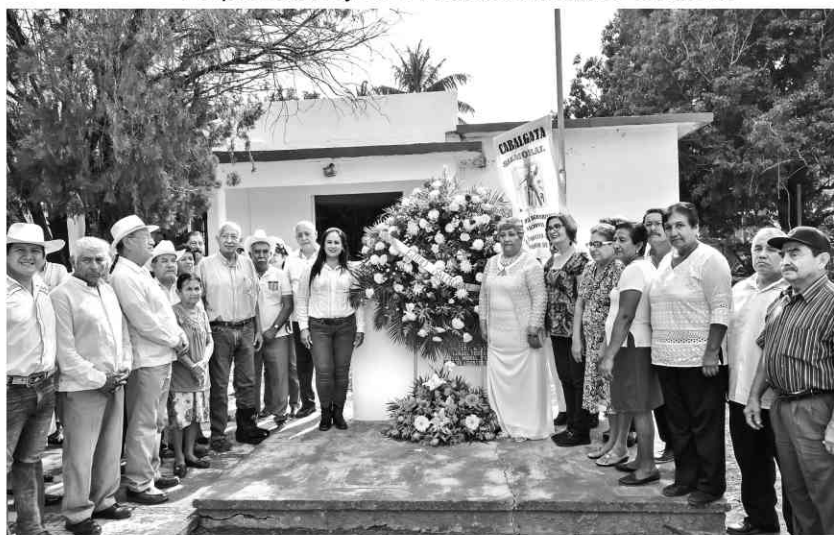
La Ofrenda Floral en el ejido El Salmoral en honor de los líderes agrarios de 1923.