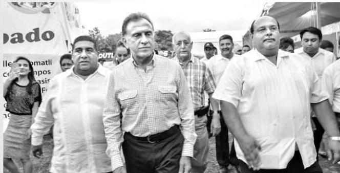
ACTOPAN.- En el recorrido por las instalaciones de la feria, el alcalde Paulino Domínguez y el tesorero Pedro Benítez Domínguez, acompañaron al gobernador Miguel Ángel Yunes.