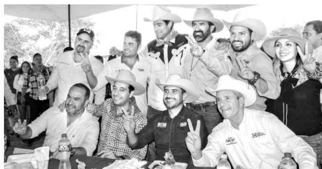
EL CHICO.- El candidato a Gobernador Miguel Ángel Yunes Márquez, en el convivio con unos 500 jinetes de varios municipios del Estado, que cabalgaron en El Chico, municipio de Emiliano Zapata, dejando claro que este tipo de eventos quienes asisten son de diferentes ideologías, la finalidad es la relación de amistad sin fines partidistas.