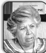
MERE TORAL CARRETO