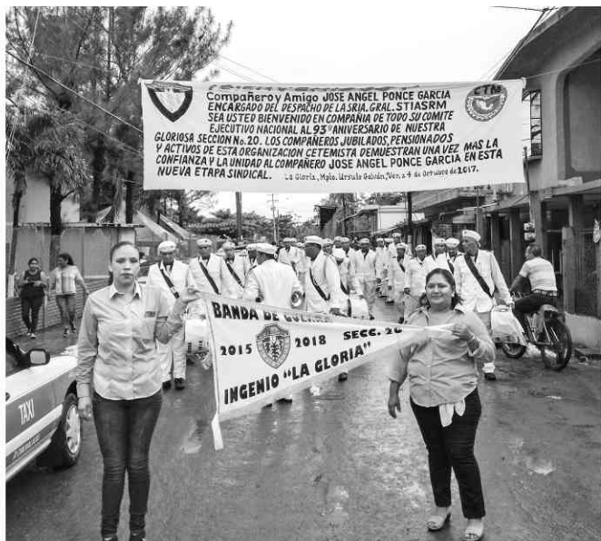
LA GLORIA.- Desde temprana hora, los trabajadores azucareros de la Sección 20 desfilaron por las calles de esta localidad, encabezados por su banda de guerra que ese día lució traje de gala.